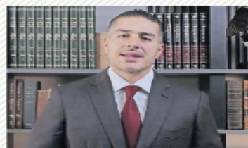
Omar García Harfuch aseguró haberse separado de su cargo para colaborar con Claudia Sheinbaum.