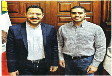
Omar García Harfuch (der.) presentó su renuncia ayer en la mañana al Jefe de Gobierno, Martí Batres.

Omar García Harfuch renunció a la Secretaría de Seguridad Ciudadana (SSC) de la Capital del País para sumarse al equipo de Claudia Sheinbaum... pero lo hizo justo en la fecha límite con la que contaba para dejar su cargo y poder participar en la contienda por la Jefatura de Gobierno.