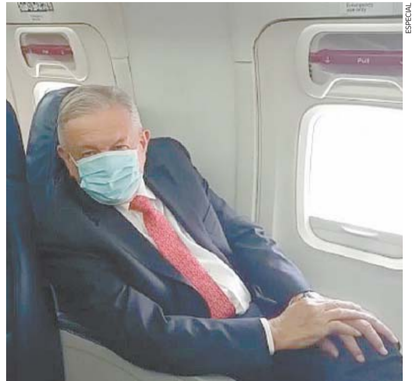
En el vuelo a Estados Unidos, por vez primera se vio al presidente Andrés Manuel López Obrador con cubrebocas desde que inició la pandemia.