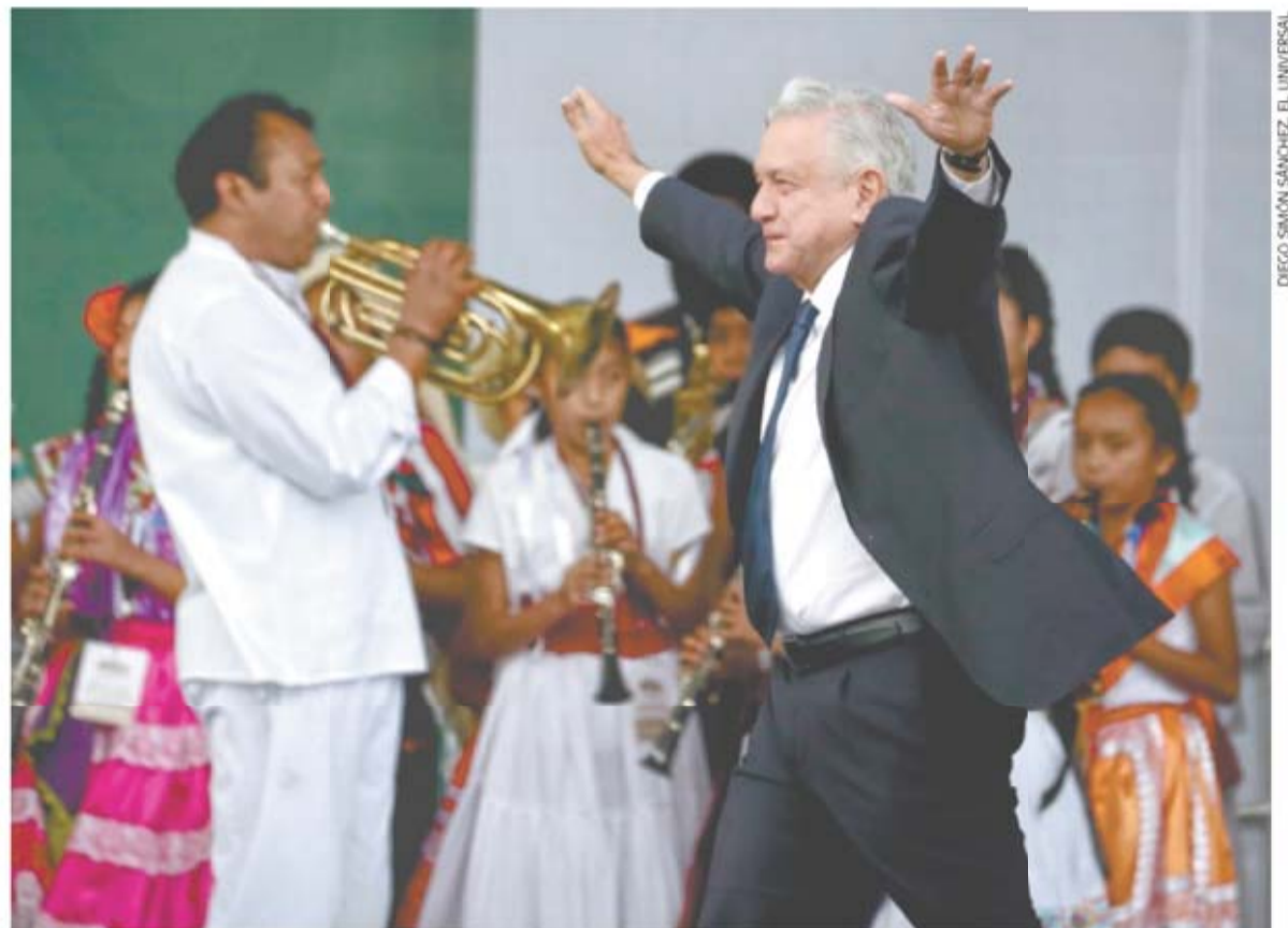
Andrés Manuel López Obrador rindió un informe de los primeros siete meses de la llamada 4T, en el que destacó que la austeridad y el combate al huachicol han significado ahorros por más de 187 mil millones de pesos.