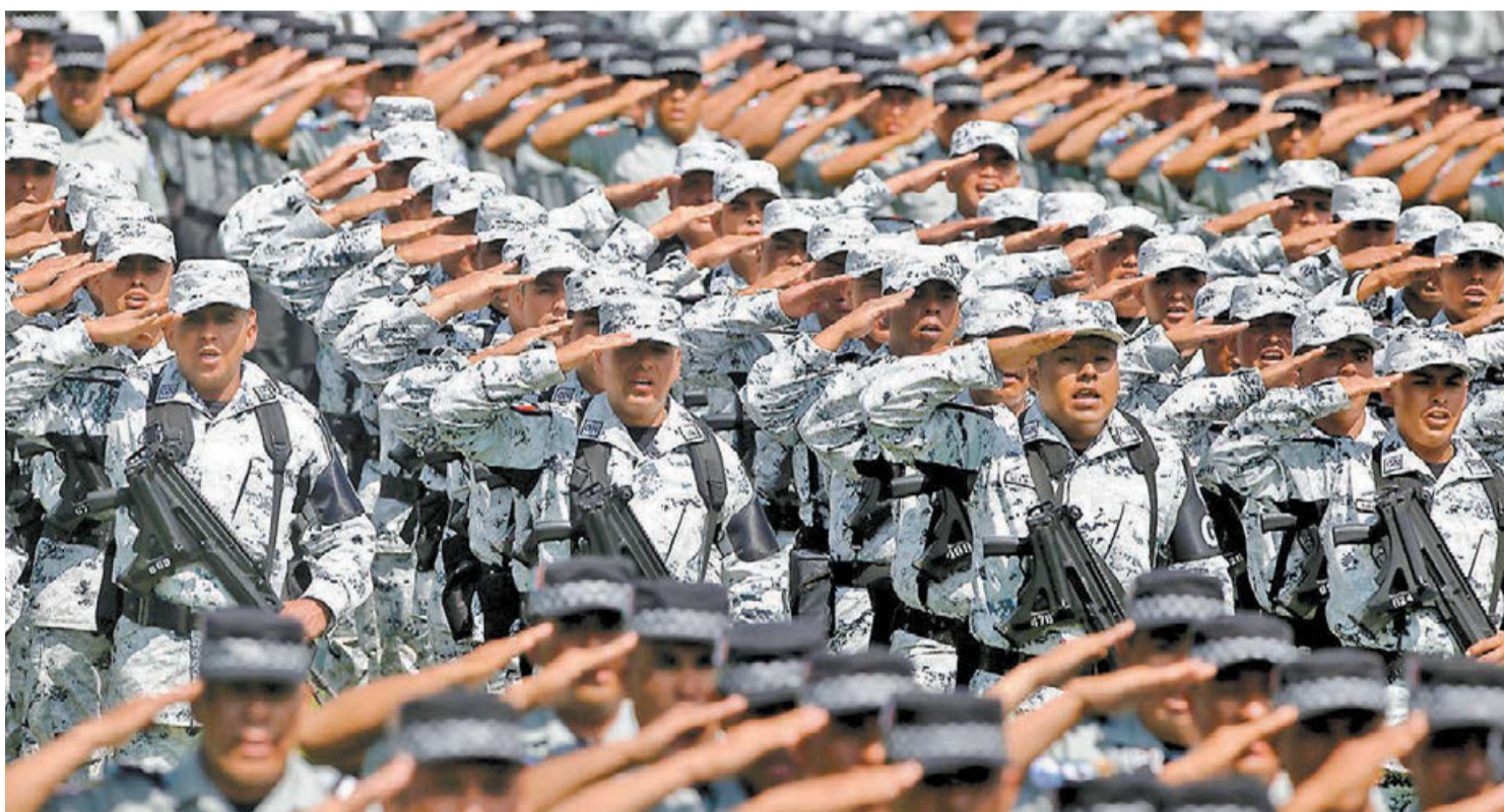
El Presidente encabezó en el Campo Marte el acto para el despliegue de 70 mil elementos en 150 regiones del país. ARIANA PÉREZ